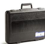
HI721006 HI96 系列专用便携箱