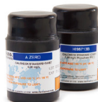
CAL Check 核查标定组