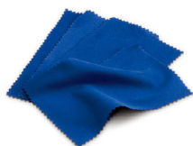
HI731318 比色皿专用清洁布